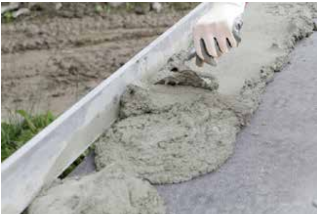
Anlegen einer Ausgleichsschicht

Die unvermeidbaren Unebenheiten des Wandauf-lagers (Betondecke, Betonfundament etc.) müssen bei Dünnbettmauerwerk durch eine gesonderte Mörtelschicht (Ausgleichsschicht) ausgeglichen werden. Diese Mörtelschicht ist in der Regel dicker als eine Dünnbettfuge. Bewährt haben sich Mauer-mörtel der Mörtelklasse M10. Die Ausgleichsschicht soll im Mittel nicht dicker als 3 cm, an einzelnen Stellen höchstens 5 cm dick sein.